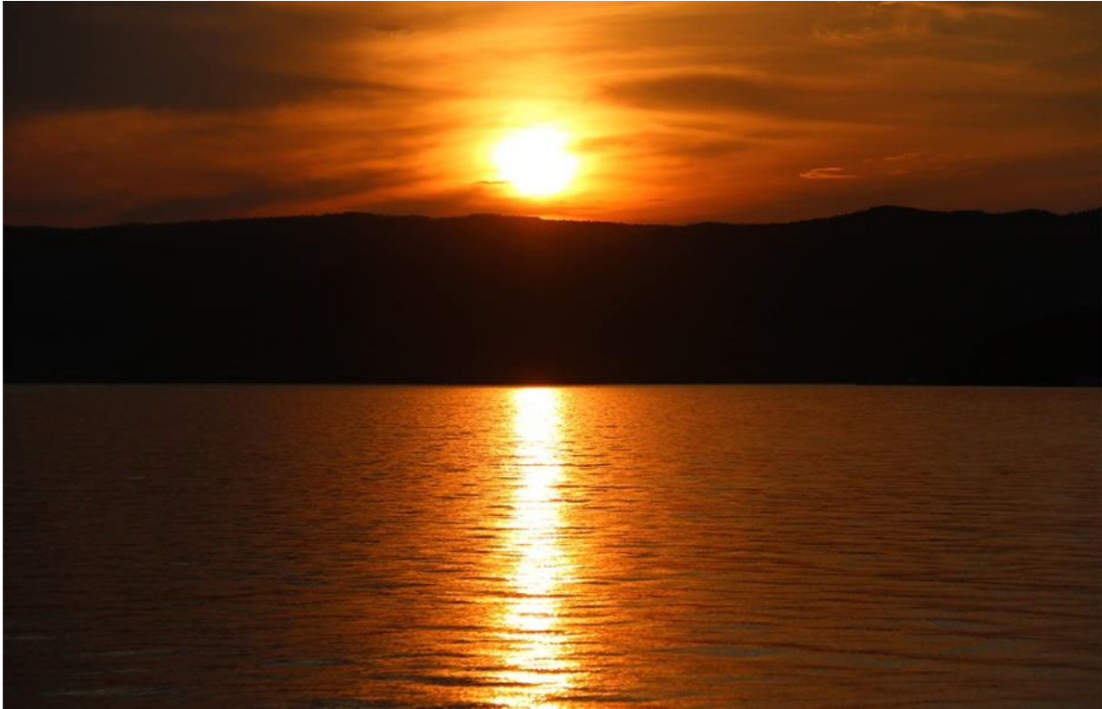
Bajkal pri západe Slnka.