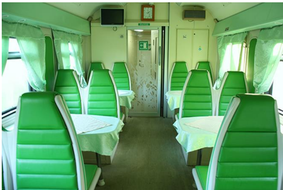
Reštauračný vozeň.

Strava na vlakových staniaciach je dobrá, preto si vždy pozrite harmonogram zastávok vlaku, aby ste vopred vedeli kde a ako dlho bude vlak stáť. Zásoby jedla si stihnete urobiť najlepšie vtedy, ak vlak stojí v stanici minimálne 20 minút . Okrem toho každý vagón má svoju sprievodkyňu, ktorá vám za ruské ruble predá kávu, čaj, sladkosti, ale aj vodu. Vo vagóne sa nachádza aj horúca voda na zalievanie polievok, kávy a čaju. Žiadne samovary v kupé už nie sú.