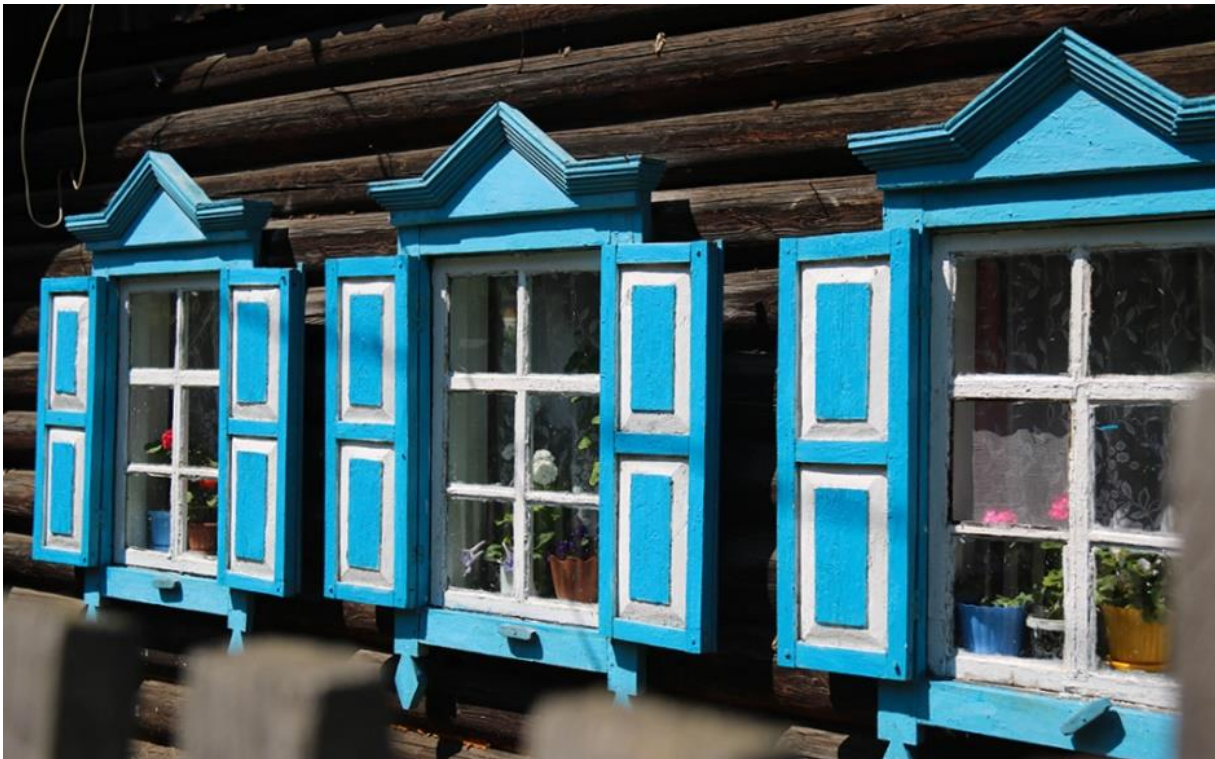
Tradičná ruská architektúra v mestečku Listvyanka.