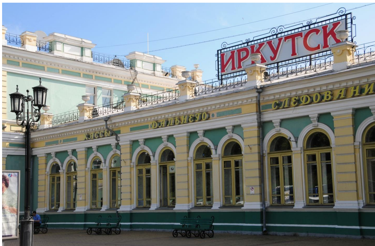
Železničná stanica v Irkutsku.

Mesto, ktoré postavili dekabristi v roku 1825, patrí medzi klenoty na Sibíri. Dostanete sa sem lietadlom, ale aj po známej transsibírskej magistrále. Neďaleko sa nachádza známe Bajkalské jazero. Mesto vyniká svojimi krásnymi drevenými budovami z 19. storočia nachádzajúcimi sa v centre mesta. Na brehu rieky stojí socha cára Alexandra III., ktorý založil transsibírsku magistrálu. Irkutsk je jednou z obľúbených zastávok na transsibírskej magistrále a dá sa povedať, už niekoľko rokov zažíva turistický boom. Svedčí o tom napríklad aj zrekonštruovaná časť, tzv. 130. kvartál, kde je množstvo zachovanej drevenej architektúry, ale aj promenáda, múzeá, kaviarne a obchody.