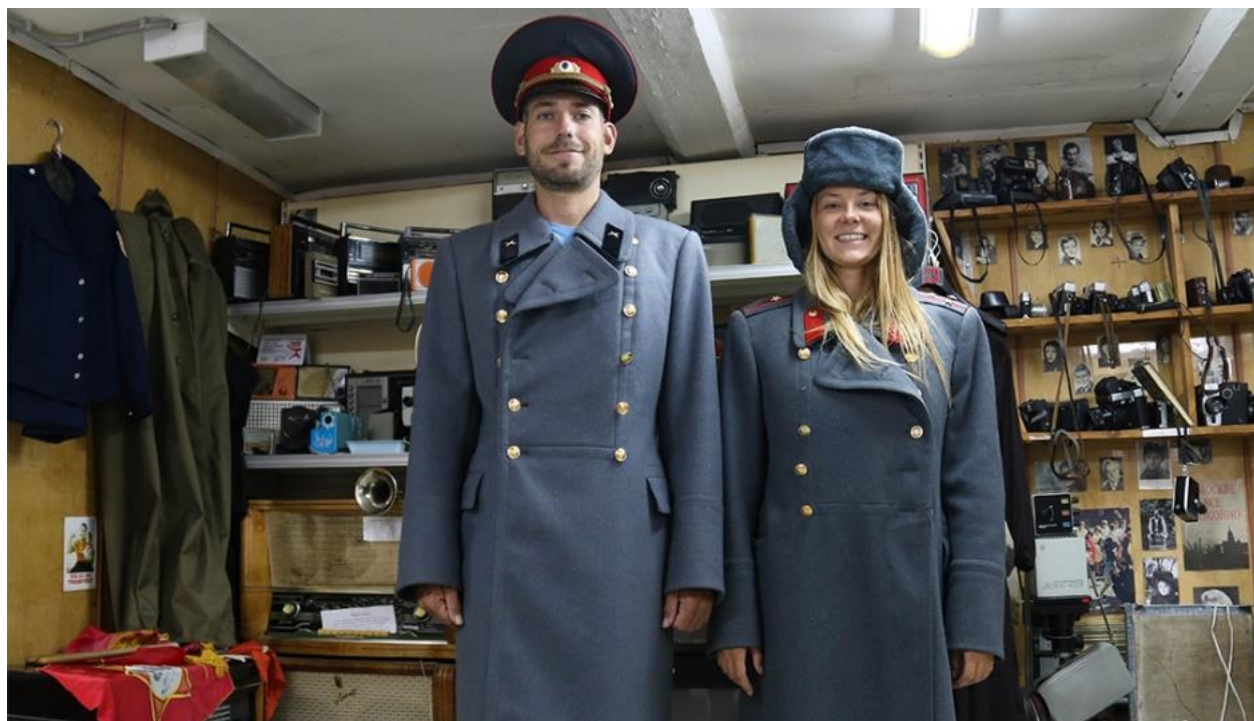
Múzeum ZSSR v Novosibirsku.

Najväčšie Sibírske mesto východne od Omsku ležiace pri rieke Ob. Mesto je dobrým východiskovým bodom do oblasti Altaj a aj pre tých, ktorí chcú ísť odtiaľ do Kazachstanu. Samotné mesto prejdete za pol dňa. Zaujímavá alebo skôr zábavná je návšteva Múzea ZSSR na ul. Gorkogo 16, kde si výstavné predmety môžete aj vyskúšať. Vstupné je 150 RUB.