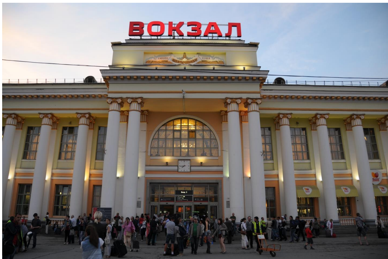
Železničná stanica v Jekaterinburgu.

Vo vlaku nájdete podrobný a presný harmonogram , podľa ktorého vlak zastavuje. Niekde postojí iba 2 minúty, inde stojí až 60 minút. Vlak nikdy nečaká! Vlak odchádza presne a nerobí kontrolu pasažierov. Ak teda počas zastávky vystúpite z vlaku, napríklad aby ste sa trošku poprechádzali alebo si niečo kúpili, vždy majte so sebou pas a peniaze. Ak by ste totiž náhodou zmeškali svoj vlak, musíte sa potom dostať do ďalšieho.