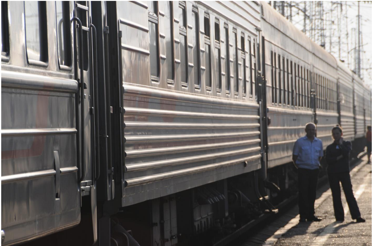
Bon voyage!