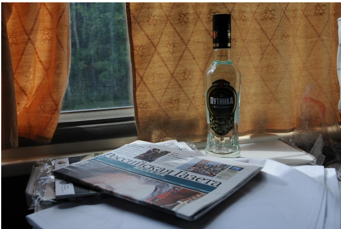
A cesta trvajúca 86 hodín sa môže začať.

Vodku kúpite v reštauračnom vozni, ale ceny sú veľmi vysoké. V ruskom vlaku môžete konzumovať aj svoj vlastný alkohol, ale decentne. Nesmiete byť hlučný a niekoho vyrušovať. Alkohol si však musíte kúpiť vopred, pretože na železničných staniach je zakázané predávať tvrdý alkohol. Pivo kúpite všade. V mongolských vlakoch je konzumácia alkoholu v zásade zakázaná, ale toleruje sa to. Fajčiť sa dá len medzi vozňami, v kupé platí prísny zákaz fajčenia.