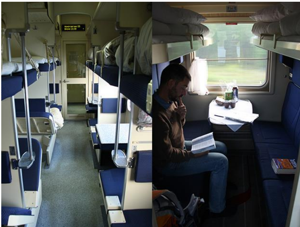
Plackartny vs. kupe.